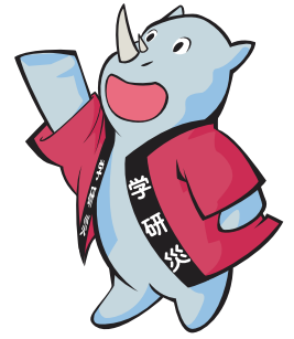
学研災キャラクター サイちゃん