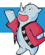
学研災キャラクター サイちゃん

拝啓 時下益々ご清祥のこととお慶び申し上げます。この度、お子様の合格を心よりお祝い申し上げます。