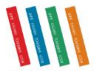
・左袖ラインカラーバリエーション