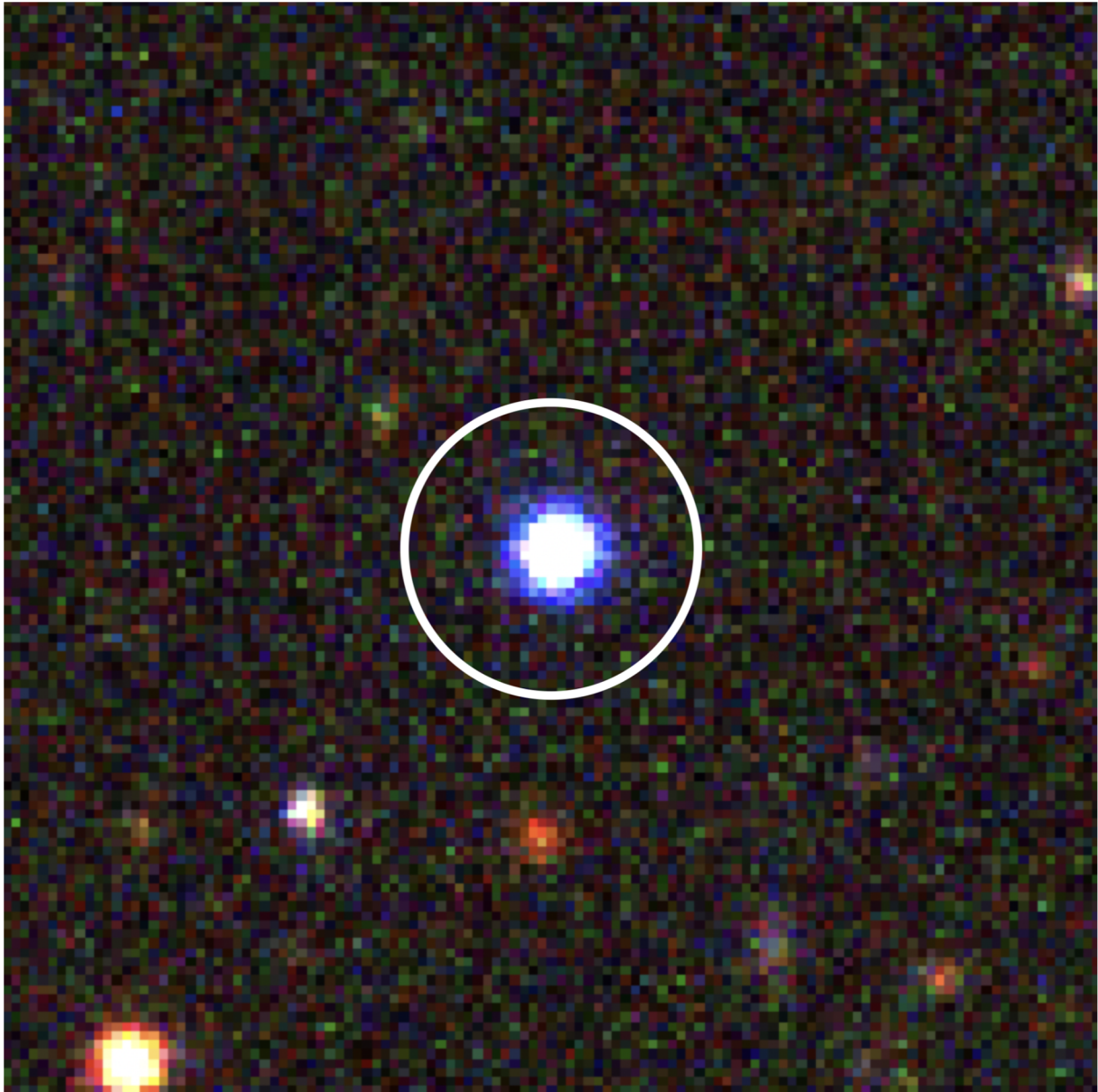
図 1 : すばる望遠鏡の超広視野主焦点カメラ (HSC) で撮影されたブルドッグの画像。3 種類のフィルター (g, r, i) で撮った画像をそれぞれ青、緑、赤の擬似カラーで表した合成画像です。ブルドッグで青い光の超過があることが分かります。